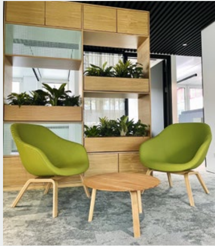
Stuttgart-Degerloch, Löffelstraße, der neue Verwaltungssitz der FLÜWO eG, der FLÜWO Bau und Service GmbH und der FLÜWO Stiftung

Die Räumlichkeiten wurden nach den neuesten Erkenntnissen einer modernen Arbeitswelt und den Anforderungen durch die sich verändernden Arbeitsweisen gestaltet. Das bedeutet, dass verschiedene Arbeitsplätze für unterschiedliche Tätigkeiten zur Verfügung stehen, darunter Räume für ruhige Arbeitsplätze, an denen volle Konzentration und Ruhe erforderlich sind, kreative Räume, in denen Ideen mit Kollegen ausgetauscht werden können, und geeignete Besprechungs- oder Projekträume für Teamarbeit. Neben der Raumgestaltung wurden auch die Möbel und die Medientechnik an diese Anforderungen angepasst. Außerdem haben wir uns auch bewusst dazu entschieden, das Gebäude nicht allein zu nutzen und freuen uns darauf, unsere Arbeitsräume mit verschiedenen Kollegen und Firmen zu teilen. Das bringt eine Vielfalt an Leben in das Gebäude. Nicht umsonst haben wir den