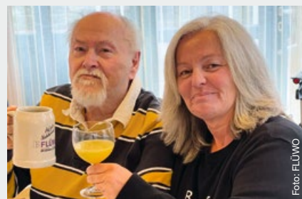
Stuttgart-West, Reinsburgstraße, Jubiläumsfeier BTW Stuttgart

In den 1980er Jahren suchte FLÜWO als Genossenschaft nach Möglichkeiten, in-