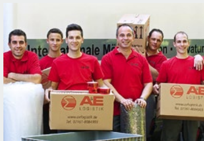
Die Umzugsprofis von A&E Logistik

Den Rabattcode erhalten Sie zusammen mit der Wohnungszusage oder mit der schriftlichen Kündigungsbestätigung. Sie haben den Rabattcode erhalten und möchten ihn nutzen? Dann nehmen Sie bitte mit A&E Logistik Kontakt auf, indem Sie den Rabattcode in das Kontaktformular von A&E Logistik eingeben. A&E Logistik wird sich mit Ihnen in Verbindung setzen und ein entsprechendes Angebot für die von Ihnen gewünschten Leistungen erstellen. Der anschließende Vertrag kommt zwischen Ihnen und A&E Logistik zustande, FLÜWO ist daran nicht beteiligt. ●