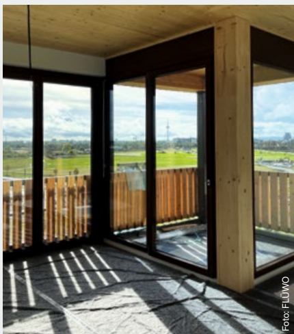
Mannheim, Spinelli-Quartier, „Spinelli-Solitär“

Beton. In die einheitlichen Holzfassaden sind auch die Brüstungen der Loggien und die Geländer sowie die Absturzsicherungen der Fenster integriert. Über eine Eckloggia verfügen 15 Wohnungen und die restlichen zwei Wohnungen im Dachgeschoss haben Dachterrassen, die den Bewohnern einen großzügigen Blick auf das BUGA-Gelände bieten. Es stehen 1- bis 4-Zimmer-Wohnungen zur Verfügung. Wir freuen uns darauf, Sie zu den genannten Terminen vor Ort begrüßen zu dürfen. ●