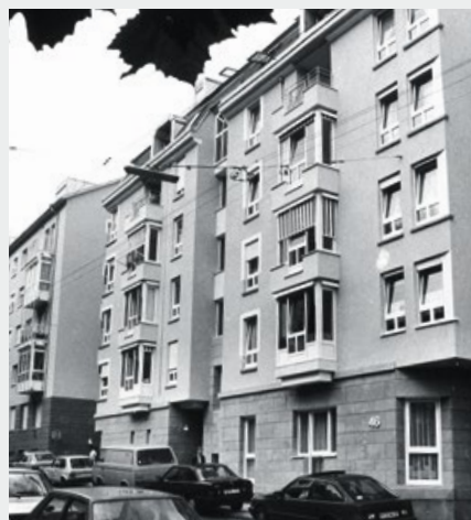
Stuttgart-West, Reinsburgstraße, 1988 vs. heute

Die 1,5- bis 3-Zimmer-Wohnungen im Betreuten Wohnen Stuttgart-West sind zwischen 35 und 75 Quadratmeter groß und speziell auf die Bedürfnisse älterer Menschen zugeschnitten. Das Gebäude verfügt über Gemeinschaftsräume und Gartenanlagen sowie über ein Notrufsystem in jeder Wohnung. ●