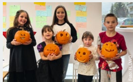
Schwetzingen, Walter-Rathenau-Straße, FLÜWO-Mobil Herbstaktion Rhein-Neckar

Die Aktion war ein gruseliger Spaß für Groß und Klein und die daraus entstandenen Meisterwerke erleuchteten in den letzten Herbstwochen die Wohnräume der Familien. Pünktlich um 15 Uhr trafen die ersten kleinen Besucher ein und es konnte gleich losgehen. Unter Aufsicht von Erwachsenen suchten sich die Kinder zunächst einen Kürbis und ein Gruselgesicht als Motiv aus, und dann ging es